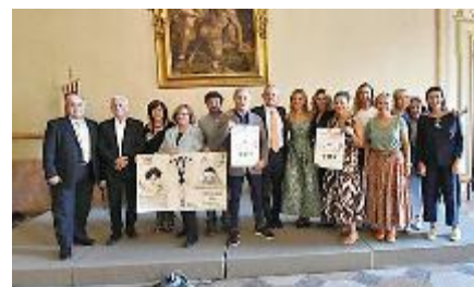
INSIEME Organizzatori ed espositori

« APPOGGIAMO sempre con entusiasmo Giardini&Terrazzi – spiega il direttore generale di Confcommercio Ascom,